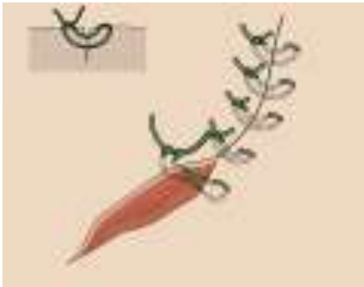
SZEW MATERACOWY PIONOWY