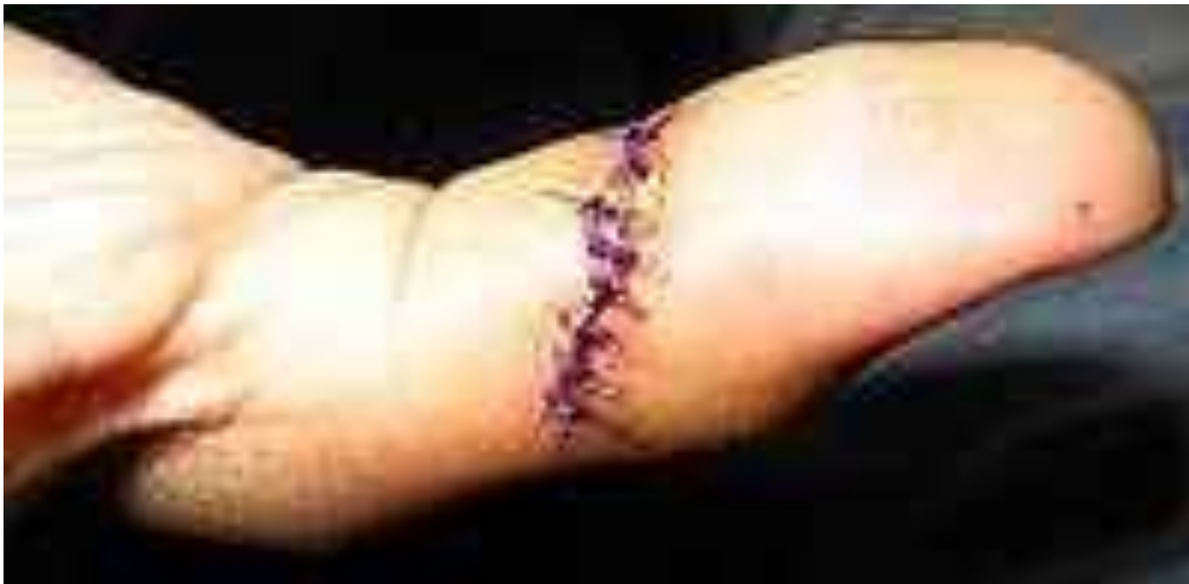
Szew niewchłanialny na lewym kciuku