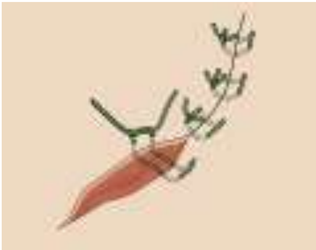
SZEW MATERACOWY POZIOMY